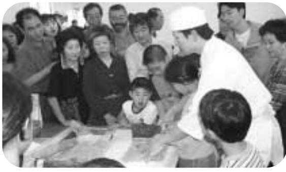
「そばは、力を入れないでも切れるからね。」