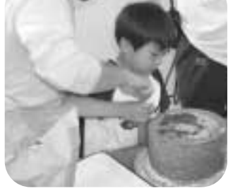
そばの実をひいてみよう!!