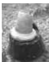
下野谷遺跡から出土した縄文時代中期後半の土器