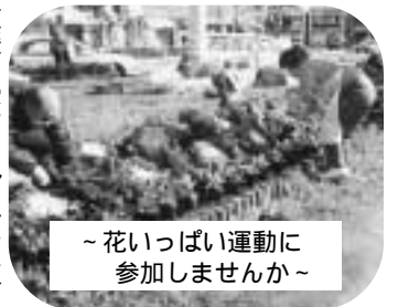
~花いっぱい運動に参加しませんか~

公共用地的花壇づくりボランティア 住民が話し合って、近くの公園、道路グリーンベルトなどの公共用地的花壇づくりを希望する場合は、市に計画書を提出して承認されれば、市から現物支援を受けられます。植え付けの計画や管理は、グループ参加者のボランティア活動で引き受けてください。連絡協議団体の指導、相談を受けられますので、花づくりの初心者でも安心して参加できます。