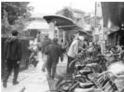
放置自転車は、迷惑になります