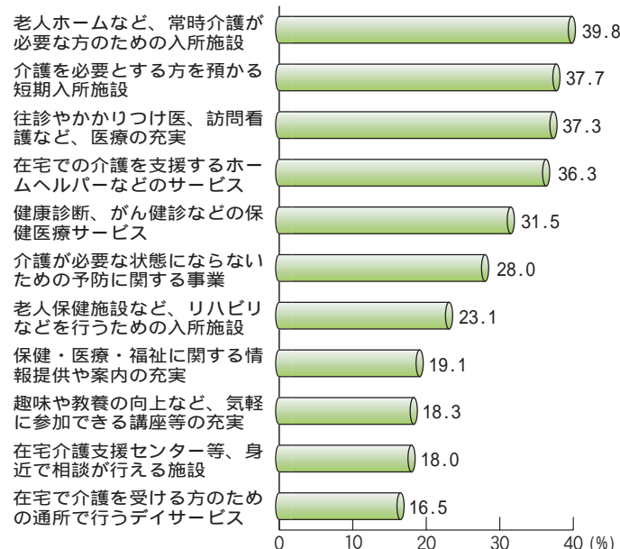
優先して充実すべき保健福祉サービスについて グラフ4

今後、市では、策定委員会等を中心に各種計画について(高齢者保健福祉計画、介護保険事業計画は平成14年度中に)策定していきたいと考えています。