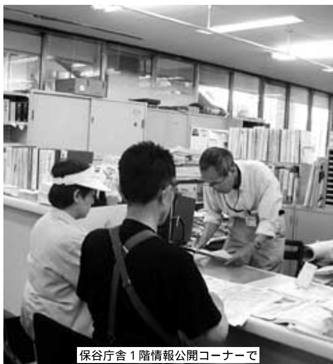
保谷庁舎1階情報公開コーナーで

40歳～69歳の基本健康診査の申し込みを開始します。集団健診と個別健診があります。ご希望の方法をお選びください。