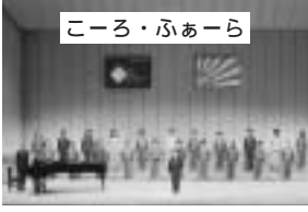
こーろ・ふあーら