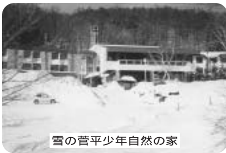
雪の菅平少年自然の家

粗大ごみの年内収集の受け付けは、12月19日(金)までとなります。お早めにお申し込みください。粗大ごみ受付専用電話(☎21-5411) ごみ減量推進課(☎区内線2221~2223)