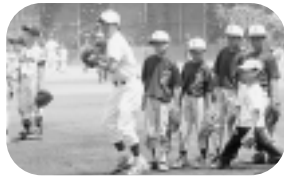
6月に実施した野球教室

早稲田大学と市教育委員会との協働事業として野球教室が開催されます。 とき 12月5日(日) 午前9時～午後4時 ところ 早稲田大学東伏見硬式野球部 対象 市内少年軟式野球チーム(小学生)・市内少年硬式野球チーム(中学生) 共催 早稲田大学スポーツセンター 申込 運動できる服装で直接会場へ 社会教育課(☎内線2711)