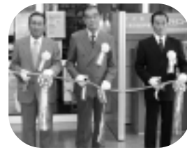
芝久保公民館に設置された住民票等自動交付機のテープカット式