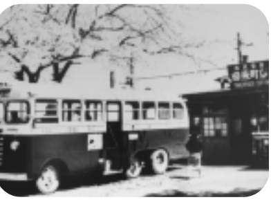
田無町駅(現ひばりが丘駅)(昭和35年ごろ)

昭和30年代を中心とした、市内の懐かしい写真を解説を交えて展示します。また、市内の駅をはじめとするシンボル施設など、皆さんなじみのある場所の写真を新旧対比して紹介するほか、市内の原風景を描いた絵画も併せてご覧いただけます。