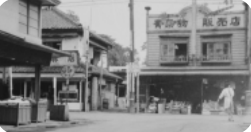
現在の田無町交差点(昭和35年ごろ)