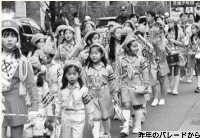
昨年のパレードから

西東京市民まつり実行委員会 生活文化課(田無庁舎 内線 1411) 産業振興課(田無庁舎 内線 1441)