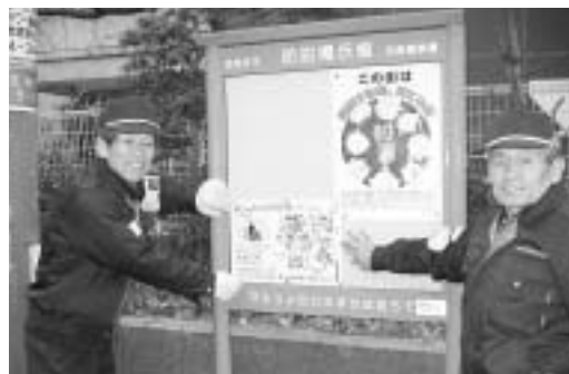
市内全19小学校の敷地周辺に、防犯掲示板を設置しました。学校区ごとの犯罪状況などが掲示されています(住吉小学校前掲示板)。