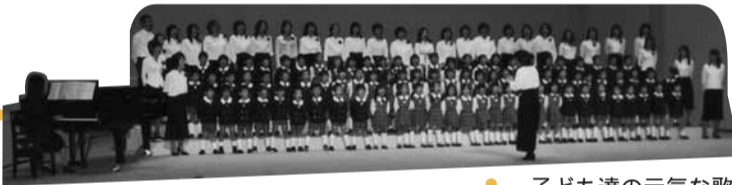
子ども達の元気な歌です

会場省略 こもれび...こ、市民会館...市、 コール田無...コ、田無公民館...田、 保谷公民館...保、ひばりが丘公民館...ひ、 如意輪寺...如