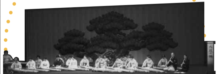
お箏の演奏会です