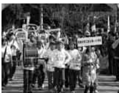
市民まつり実行委員会(生活文化課内☎内線141)