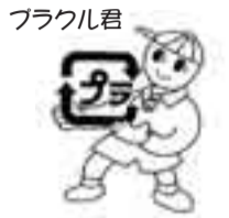
平成19年10月からの不燃ごみの分別と処理

現在、市の指定収集袋を作製中です。材質は焼却しても有害ガスを発生しないポリエチレン製で、10枚1組のロール状に巻いたものになります。黄色の「可燃ごみ・不燃ごみ兼用袋」には、可燃ごみと不燃ごみの代表的なものをイラストで印刷します。ピンクの「プラスチック容器包装類専用袋」には、市で考案したプラスチック資源化のキャラクター「プラクル君」が印刷されます。今後、指定収集袋の寸法や販売店についての情報等も決まり次第お知らせします。