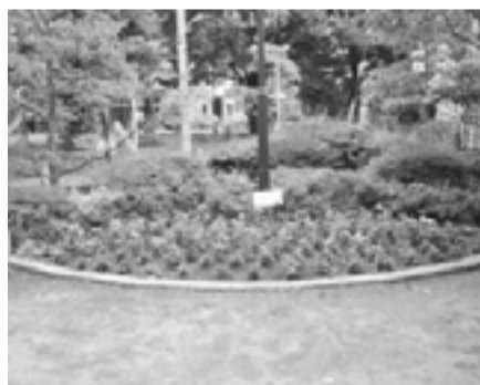
ひょうたん島公園