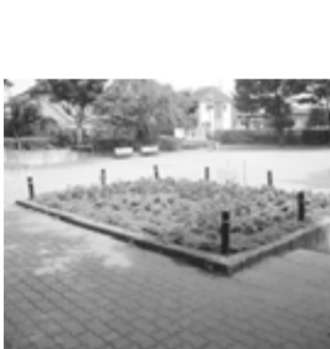
しじゅうから公園