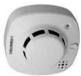
煙を感知する型の住宅用火災警報器です。