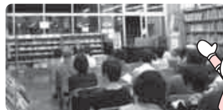
大人のための朗読のタベ(中央図書館)