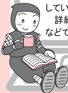
図書館キャラクター にしとくとうきょう 西都 右京くん