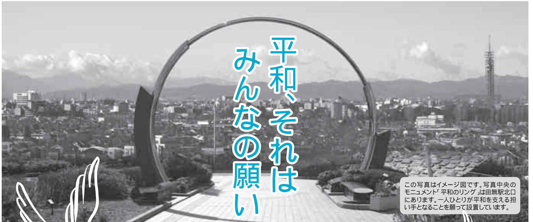
この写真はイメージ図です。写真中央のモニュメント「平和のリング」は田無駅北口にあります。一人ひとりが平和を支える担い手となることを願って設置しています。