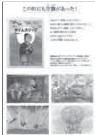
●西東京市戦災パネルの1枚目