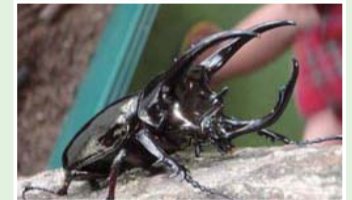
アトラスオオカブト

国内でほとんど公開されたことのない「ニセハナマオウカマキリ」のほか、クワガタムシのギネス級サイズの標本展示や、大型ケージに入って、生きた昆虫と触れ合うこともできます。そのほか、期間中に特別講演会や標本作り教室も開催します。