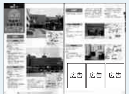
広告掲載イメージ