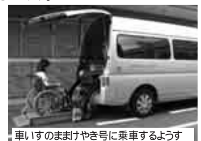
車いすのままけやき号に乗車するようす