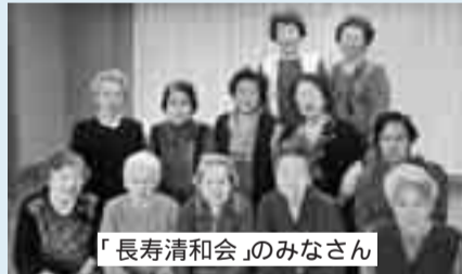
「長寿清和会」のみなさん

★いきいきミニデイ 「であいステーションはまゆうの会」 平均年齢87.0歳 全団体平均77.4歳)