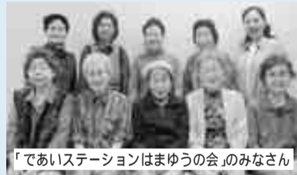
「であいステーションはまゆうの会」のみなさん

★いきいきミニデイ 「であいステーションはまゆうの会」 平均年齢87.0歳 全団体平均77.4歳)