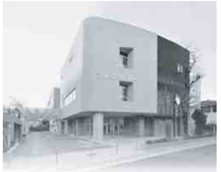
□所在地 田無町4-17-14 □アクセス 西武新宿線田無駅から徒歩7分

障害のある方だけでなく、地域の皆さまにも広く活用していただけるよう、情報コーナーや会議室を備えています。