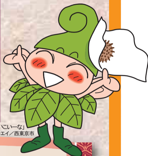
「いいいな」