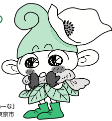
「いこいな」 ©シンエイ / 西東京市