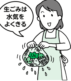
生ごみは 水気を よくきる

可燃ごみの中の約40%は生ごみで、その内約90%は『水分』です。生ごみの『水切り』『乾燥』をするだけでも、可燃ごみの大幅な減量となります。また、清掃工場では800℃以上で、ごみを燃焼し続けなければなりません。水分を少なくすることにより、燃焼の効率が上がります。