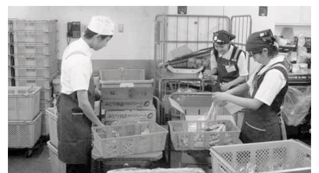
スーパーマーケットでの職場体験の様子(昨年度)