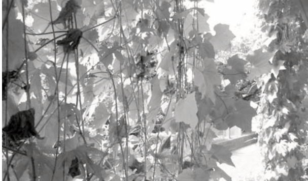
ゴーヤでつくる緑のカーテン

た」との声も。エアコンはたくさんの電力を必要とします。楽しく工夫して、エコで快適な夏を過ごしましょう。エコプラザでは、下記の通り今年も緑のカーテンの講座を開催します。また、市HPでもゴーヤの育て方を紹介しています。まだやってみたことがない方も、これを機会に挑戦してみませんか。