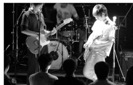
下保谷児童センターのイベント(イメージ)