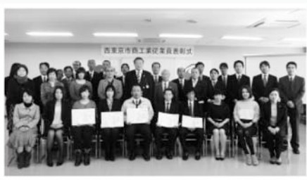
表彰を受けられた皆さん

西東京商工会と市の共催により、永年にわたり市内の同一事業所に勤務する従業員の方の表彰式が、11月20日(水)田無庁舎で開催されました。優良従業員表彰(勤続10年以上)52人、永年勤続表彰(勤続20年以上)20人、永年勤続表彰(勤続30年以上)9人、特別表彰(勤続45年以上)2人の皆さんが表彰を受けました。