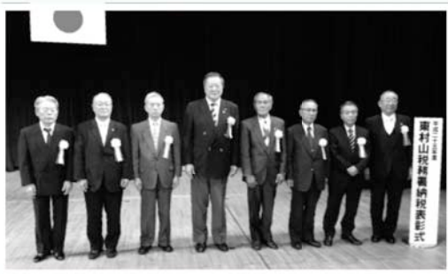
表彰式後の壇上にて