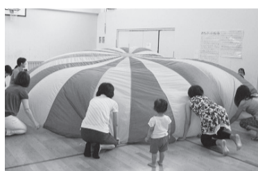
みんなで一緒にふれあいあそび

持 上履き(親子とも)、動きやすい服装 問 各児童館・児童センター ※0・1・2歳児向けの活動も実施中! ※市HPキッズ版「にしようきょうキッズ!」では、詳しい日程や各館の乳幼児向け情報を掲載しています。 ◆児童青少年課田 (☎042-460-9843)