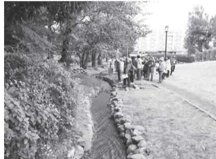
谷戸せせらぎ公園