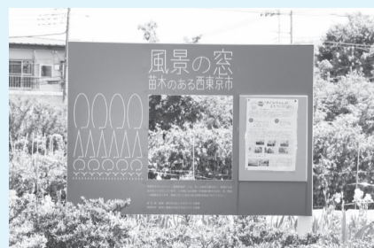
「風景の窓」あなただけの風景が見つかります

1kmほど進むと緑道沿いに「風景の窓」が見えてきます。西東京市が「都内でも有数の苗木の産地」であることを広くPRするための看板で、中央に四角い穴が開いています。写真のフレームに見立ててその中をのぞいてみると…?