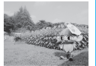
昨年のひまわり畑