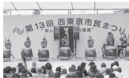
特設ステージでの演芸