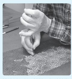
柿渋紙を彫る精緻な伝統技術