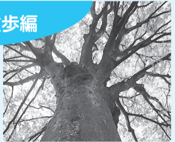
天を突く總持寺のケヤキ

西東京市には市が指定している天然記念物が2つあります。「總持寺のケヤキ」(田無町3-8-12)と「田無神社のイチョウ」(田無町3-7-4)です。どちらも今や天を突く大木で、天保13(1842)年から嘉永3(1850)年にかけて現總持寺である西光寺の本堂を再建した折に、その落慶を記念して植えられたと伝えられる古木です。 秋になると、田無神社の境内はイチョウの葉で黄金色に染まり、生り年には、銀杏の実が雨のように建物の屋根をたたきます。11月の酉の日には境内で酉の市が開かれ、熊手の鈴と威勢の良い手打ちの音は季節の風物詩の一つです。 また、今年もこの日には本殿などが