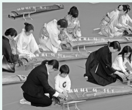
昨年度の箏曲体験