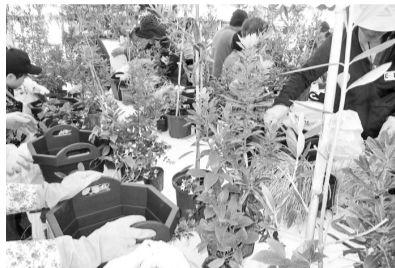
アレンジメントする市民の皆さん

申 9月29日(金)(必着)までに、往復はがきで参加者全員の住所・氏名・電話番号・希望する回・代表者名を〒202-8555市役所産業振興課へ ※申込は1件につき2人まで ◆産業振興課 ☎042-438-4044