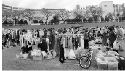
毎年ぎわうフリーマーケットコーナー