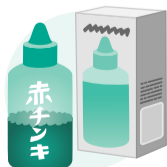
マーキュロクロム液