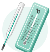
水銀体温計・温度計