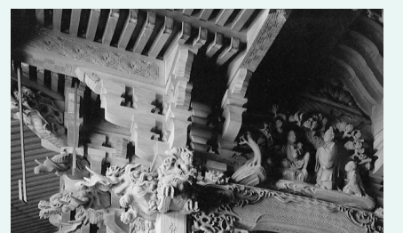
田無神社本殿に施された彫刻

ことにも表れています。田無神社本殿に描かれている水をめぐる孝行息子の物語や天神社拝殿の壁に描かれている波や龍の意匠はその一つです。