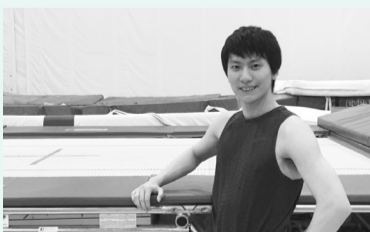
世界大会で好成績を収めた棟朝選手