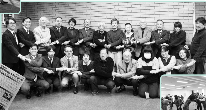
広報誌を年2回発行 (公共施設などで配布)