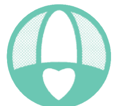
南部ネットシンボルマーク 南部地域にハートマークを描いています。

活動開始から丸2年を迎える南部地域協力ネットワーク。「当ネットワークのPR」と「南部地域の状況や各団体の活動の情報共有」を2本柱に活動中です。ぜひ一緒に活動しましょう。