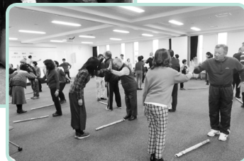
防犯講座 安全・安心なまちづくりの第一歩