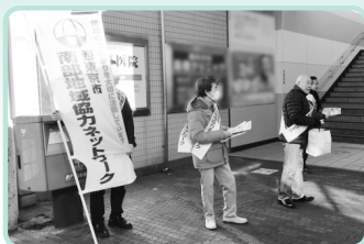
あいさつ運動 田無・西武柳沢駅にて