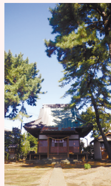
アカマツの美しい冰川神社境内

にしました。立派な赤松のある境内の本殿の向かって左にある小さな祠の前に建つ石碑に刻まれた文字を見てください。「上保谷村」と「榛名大権現」の文字を読むことができます。