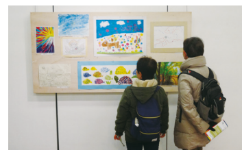
パラアート展覧会の様子

□表彰式 時 3月2日(土)午前11時～正午 場 コール田無 ※会場へは公共交通機関をご利用ください。 ※詳細は市HPをご覧ください。 ▶文化振興課(保)☎042-438-4040