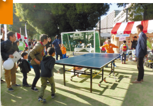
オランダ人パラリンピアンと卓球交流