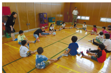
オランダ人専門家ワークショップ