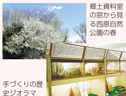
手づくりの歴史ジオラマ

ご紹介した6つのストーリーを自分なりにたどってみるのも楽しいでしょうし、新たなストーリーを作り上げるのも楽しいことと思います。これを機会に、郷土資料室や図書館を訪ねたり、道端にある文化財に足をとめたり、文化財に関わる活動に参加してみたりしてはいかがでしょうか。西東京市がより一層魅力的なふるさととして感じられることと思います。