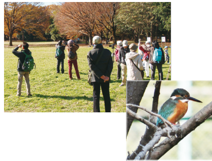
カワセミ

☎エコプラザ西東京 ☎042-421-8585 FAX 042-421-8586 ☎ecoplaza@city.nishitokyo.lg.jp ▶環境保全課 ☎042-438-4042