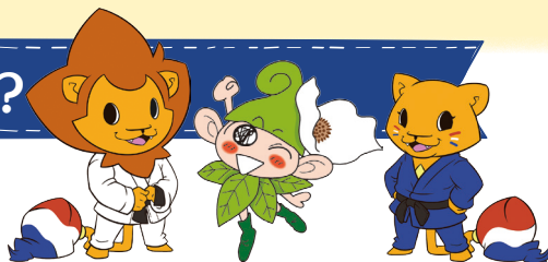
レンジ* いこいな ランダ* ※オランダ大使館マスコットキャラクター

東京オリンピック・パラリンピック競技大会に向けて、大会参加国とのさまざまな交流を図り、地域の活性化などを推進するため国から登録を受けたまちのことです。