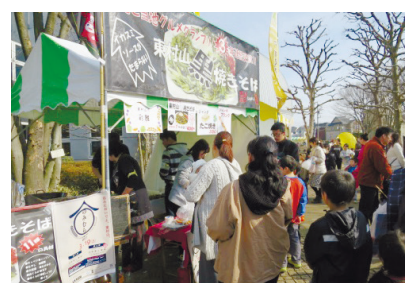
グルメフェスティバル

験ショーなど(3日のみ) ●ラボまつり…展示室にある4つの「ラボ」を全てオープン！観察・実験・工作が気軽に楽しめます。(両日) ●ボランティア会のわーくわく科学広場(両日) □保谷駅南口より無料シャトルバス 時 3月3日(日)午前8時45分・9時40分・10時35分・午後0時30分・1時45分 場 ・ 問 多摩六都科学館 〒188-0014 芝久保町5-10-64 ☎042-469-6100 休館日：18・25日(月)