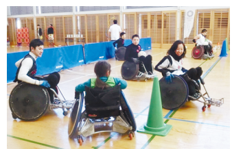
パラスポーツ体験