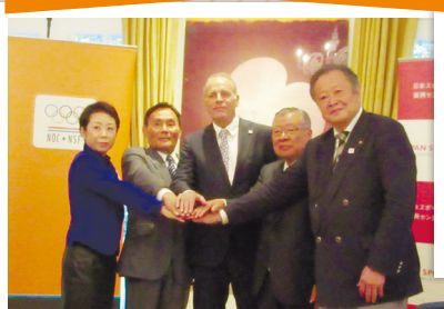
調印式(平成29年10月10日)