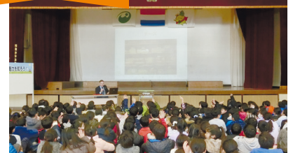
オランダ人講師の特別授業