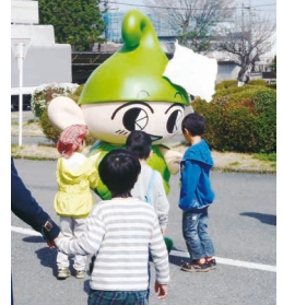
いこいーなも参加予定

4月から小学校に入学する子どもを対象に、交通安全について家族で学べる集いを開催します。警察官による交通安全のお話や人形劇による交通安全に関する劇など予定しています。 ※詳細は市HPをご覧ください。 ▶ 道路管理課 電話 042-438-4055