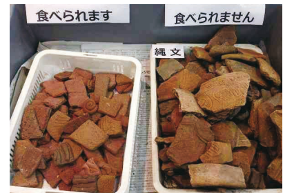
できるかな?土器そっくりの「ドッキー」