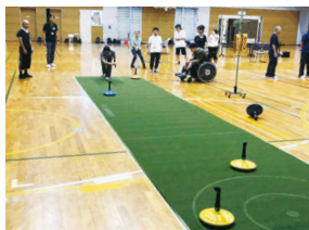
サークルを狙ってストーンを滑らせるユニカール

ポーターの養成講座を開催します。 ※参加者にはサポーターの証しであるサポートバンダナ・キーホルダーを贈呈 内 ヘルプカード・ヘルプマークとは など 申 前日までに電話で問へ 問 社会福祉法人さくらの園・カノン 電話 042-452-7062 ▶ 障害福祉課 電話 042-438-4033