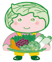
西東京市 農産物キャラクター 「めぐみちゃん」