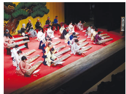
箏曲の部の発表の様子