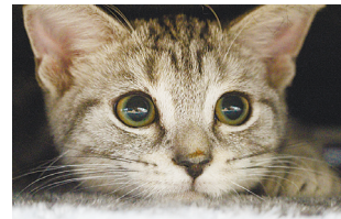
写真: 昨年特賞作品