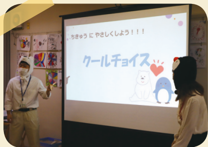
市職員が「シロクマ」・「ペンギン」にふんして登場