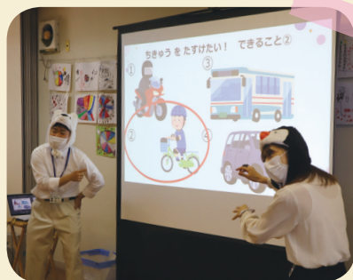
地球をたすけるため、「シロクマ」「ペンギン」が暑くならないためにはどうしたらいいか考えました。

最後に、「クールチョイス 西東京市」をプレゼント。シールを貼ったり、めくって遊びながら学ぶことができます。