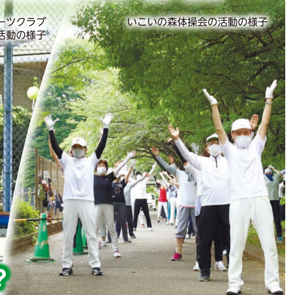
いこいの森体操会の活動の様子