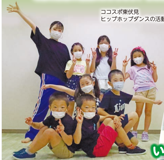
ココスポ東伏見 ヒップホップダンスの活動の様子

市民の皆さんのスポーツ・運動、健康づくりのきっかけをお手伝いするスポーツ相談窓口を「きらっと」内に開設します! 年齢や障害の有無にかかわらず、どなたでもご利用いただけます。 ▶スポーツ振興課 ☎042-420-2818