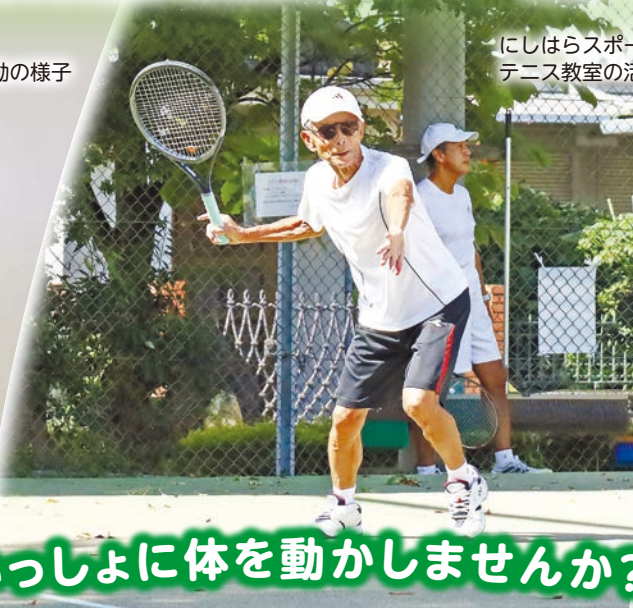
にしはらスポーツクラブ テニス教室の活動の様子