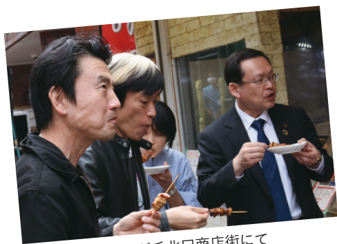
ひばりが丘北口商店街にて