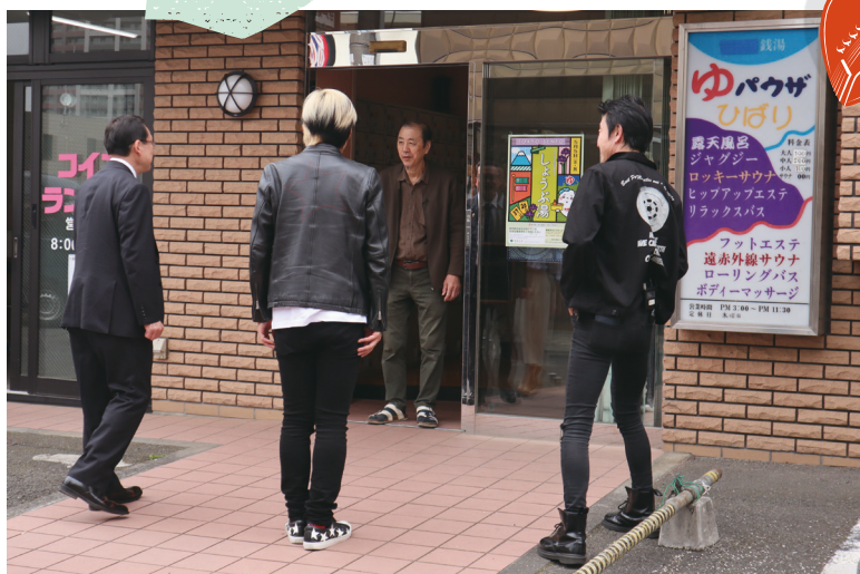
ライブ後の癒やしの場である銭湯「ゆパウザひばり」オーナーともご挨拶