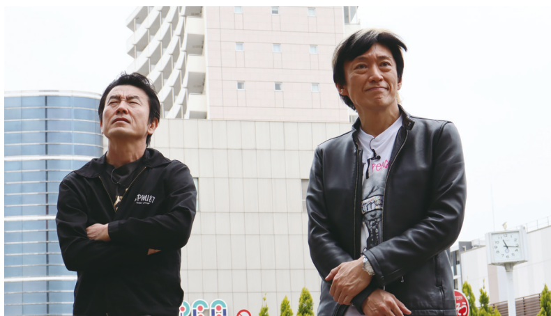
「Let's Go ヒバリヒルズ」PVの撮影当時の思い出を懐かしむ2人

小林さん 35周年にライブが開催できることをうれしく思います。これをきっかけに今後もいろんなイベントができるとなうれしいのではないかと考えています。