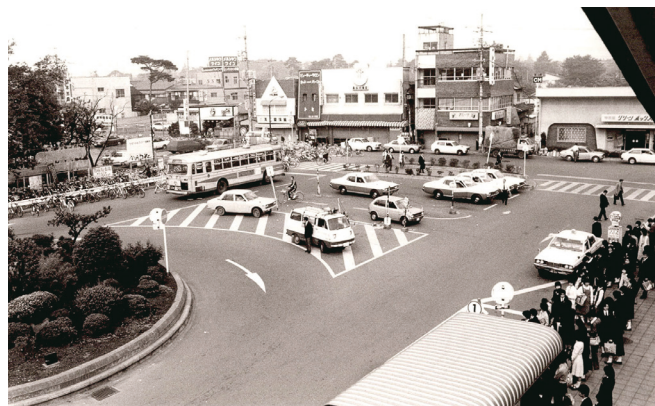
昭和50年代のひばりヶ丘駅南口