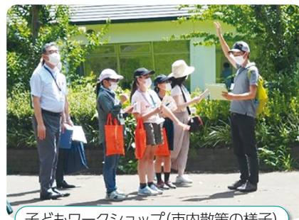
子どもワークショップ(市内散策の様子)