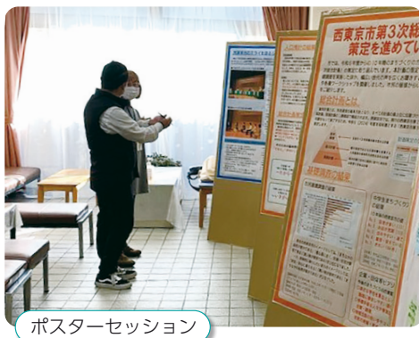
ポスターセッション