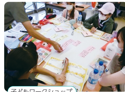
子どもワークショップ