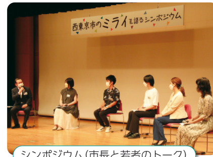
シンポジウム(市長と若者のトーク)