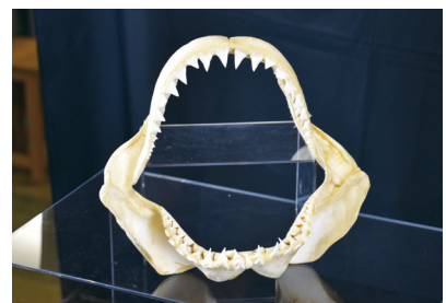
ホホジロザメの顎の標本

企画展で展示しているいろいろな魚の顎の標本や生きている魚の口の観察を通して、「どうしてこんな形なんだろう?」と考えて調べてみると、魚の知らなかった生態を知ることができます。