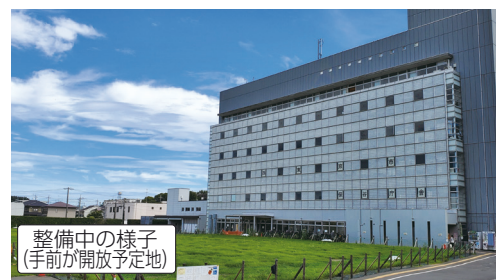
整備中の様子(手前が開放予定地)

庁舎統合方針の見直しを踏まえ、暫定的な跡地活用までの間、市民の皆さんにご利用いただける広場として開放します。 芝生などが生い茂る自然に近い環境で、みどりを感じ、憩いの空間としてご利用いただけます。